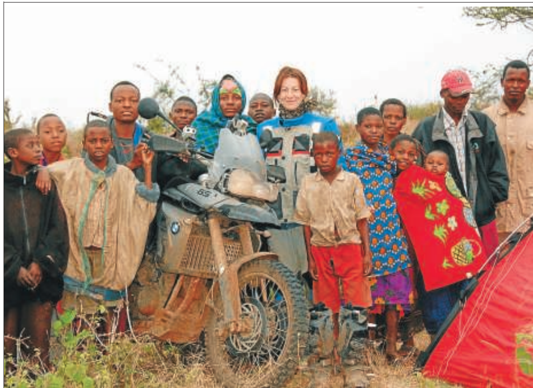
Gleich in zwei Länder und Erdteile entführt das Ehepaar Schwarz von Touratech die Besucher. Gezeigt werden eine Motorradtour um den Victoriasee und eine Radtour durch Kuba (Bild rechts).

Deißlingen. Bei einem tragischen Verkehrsunfall in Deißlingen ist am Donnerstagvormittag eine 58-jährige Radfahrerin ums Leben gekommen. Die Radfahrerin befuhr gegen 9.45 Uhr die abschüssige Schulstraße in Richtung Friedrichstraße. Zeitgleich fuhr ein 69 Jahre alter Mann mit seinem Traktor und einem angehängten zweiachsigen landwirtschaftlichen Anhänger mit Split beladen auf der Friedrichstraße aus Richtung Stauffenbergstraße kommend. Nach den Ermittlungen wollte der Traktorfahrer dem Verlauf der Friedrichstraße folgen und übersah an der Einmündung die vorfahrtsberechtigten Radfahrerin. Die Frau bremste voll ab und stürzte auf die Fahrbahn, prallte gegen das Hinterrad des Traktors und wurde vom Anhänger überrollt.